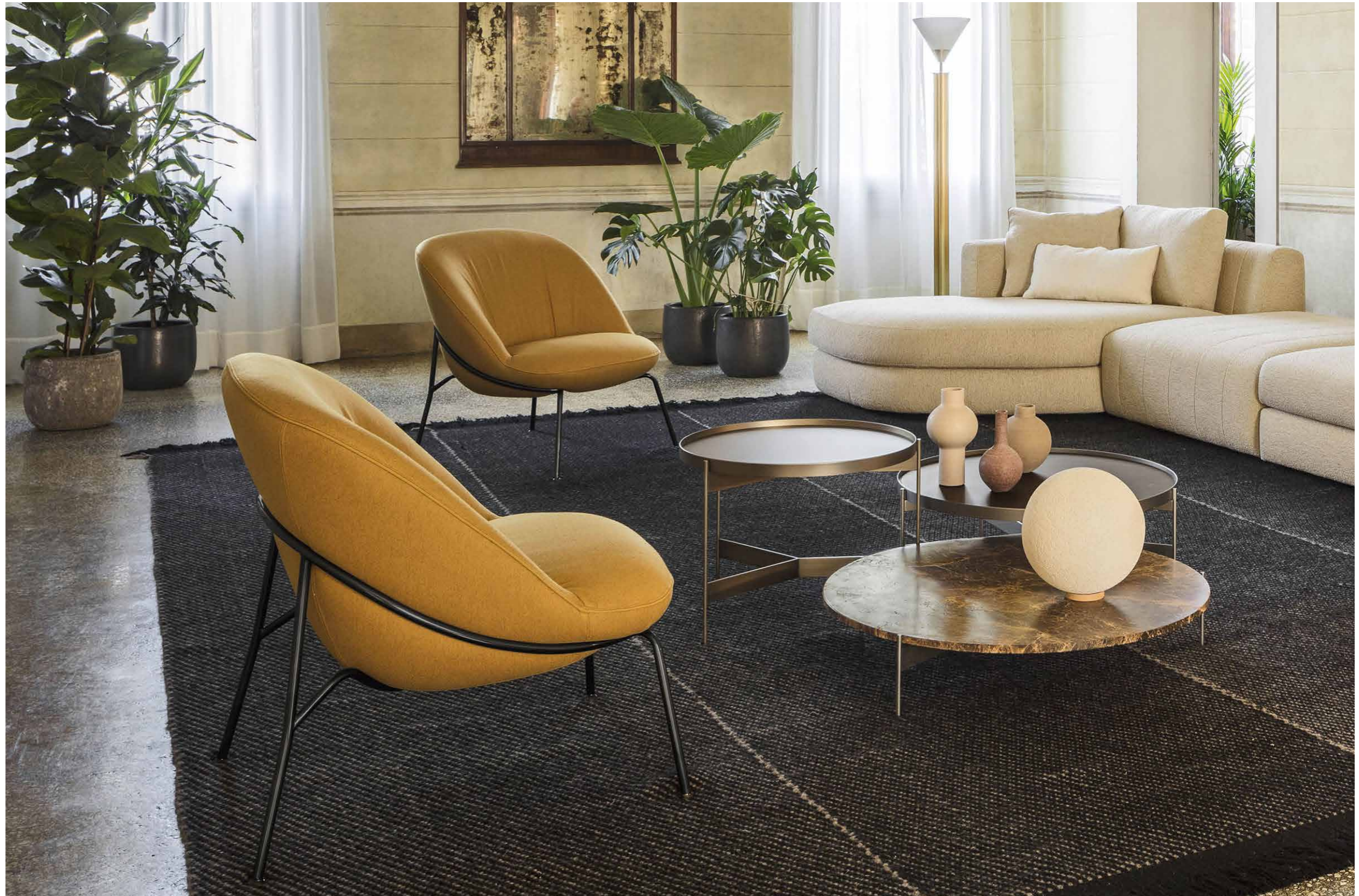
Ella poltrona in tessuto Erica 82 con profilo Gros Grain col. 63. Basamento laccato Nero. / Ella armchair in Erica 82 fabric with Gros Grain edging col 63. Nero lacquered base.